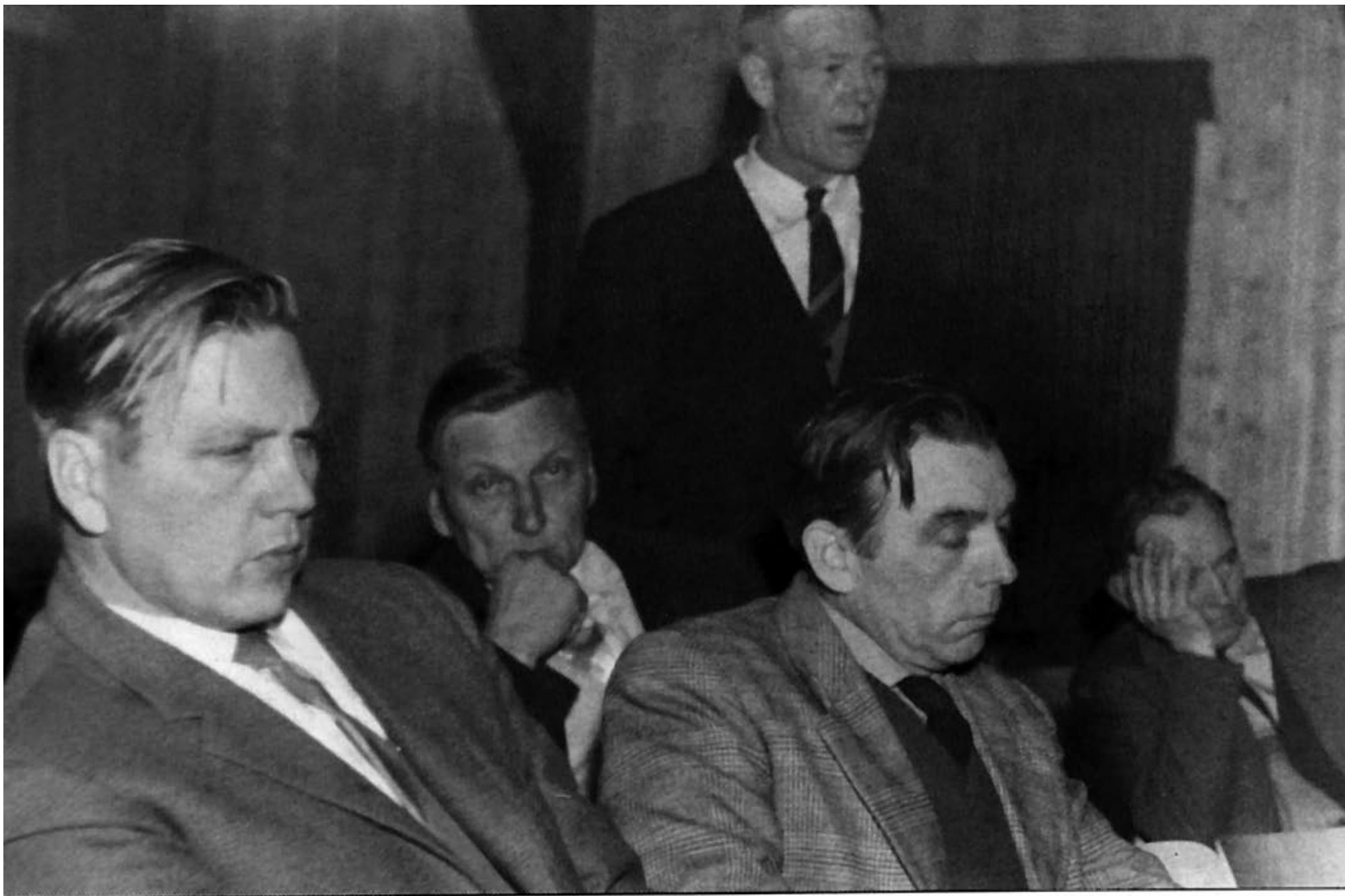
Eit kjedeleg politisk møte i Nes Ap?